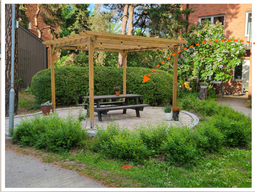
På nedre gården mitten mot port 13!